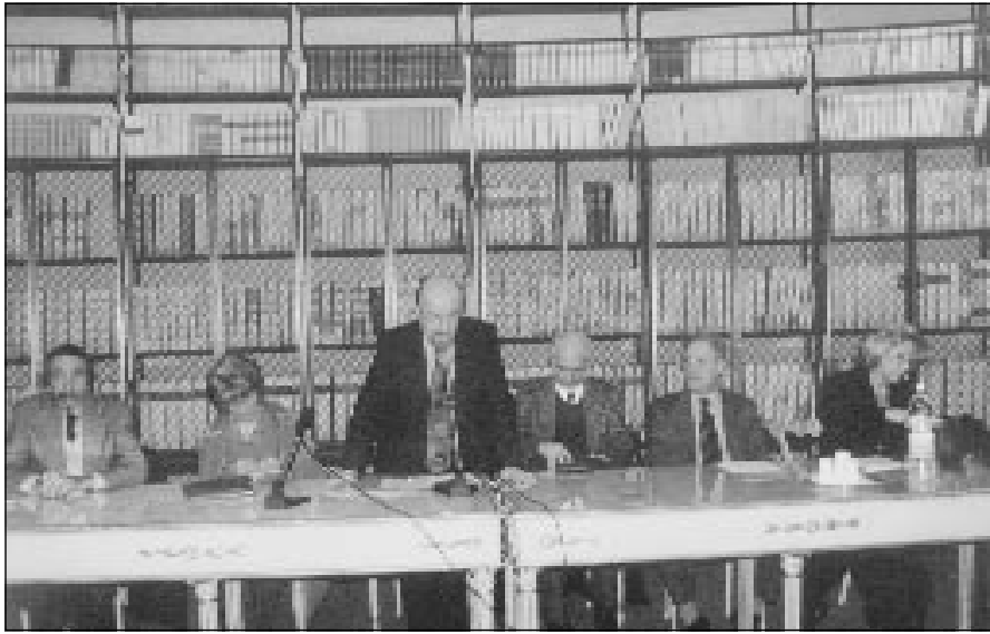
Un momento della Tavola Rotonda

e gusti personali, dettati dai differenti percorsi artistici condotti.