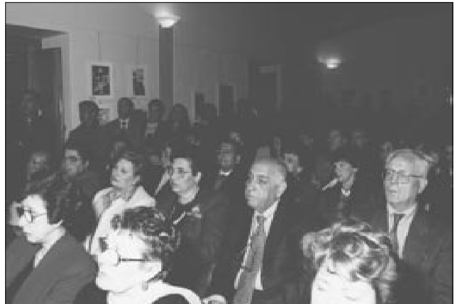
Il pubblico intervenuto a Villa Cosentino.

luoghi ormai mutati o non più esistenti ma parte essenziale del patrimonio cromosomico, oserei dire, di questa terra. Il volume è stato oggetto di una delle manifestazioni commemorative del Cinquantenario dell'Autonomia ed è stato presentato dall'architetto Ivo Celeschi.