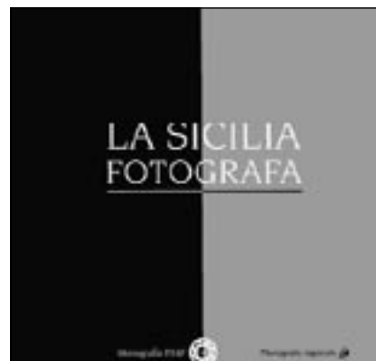
La copertina della Monografia Fiaf.

di rappresentazioni sacre, di mestieri e paesaggi di Sicilia.