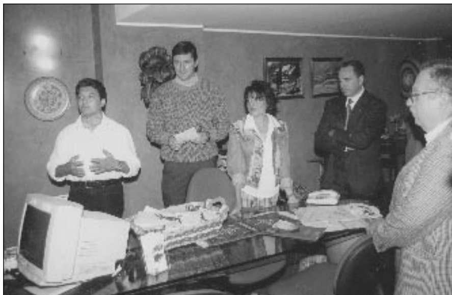
Un momento della cerimonia di inaugurazione della mostra.

Continua con la collaborazione della Scuto Viaggi e Turismo di Acireale l'opera di promozione della cultura fotografica offrendone la più ampia fruizione possibile grazie alla validissima formula della "mostra in vetrina".