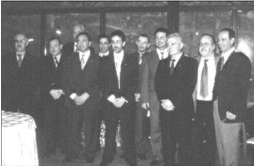
Il nuovo Consiglio Nazionale della FIAF per il triennio 2002-2005.

Anche quest'anno un gruppo di soci del nostro Gruppo ha intrapreso l'avventura per partecipare al Congresso.