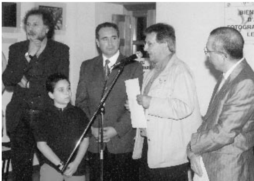
L'intervento del fotografo ragusano Giuseppe Leone.