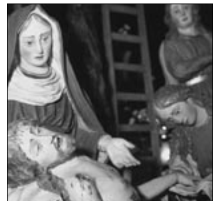
La Madonna col Figlio morto - Foto di Valerio Cimino.