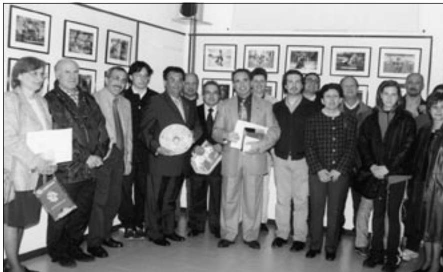
La Famiglia Bracci, assieme ai Soci del G. F. Le Gru, all'inaugurazione della mostra.

I volti di questi atleti difficilmente si legheranno a comporre il volto del grande dio mediatico creatore di eventi internazionali. Sono figli di un dio minore questi atleti ma sarà forse proprio questo a dare alle loro performances il sapore di autenticità che queste imma-