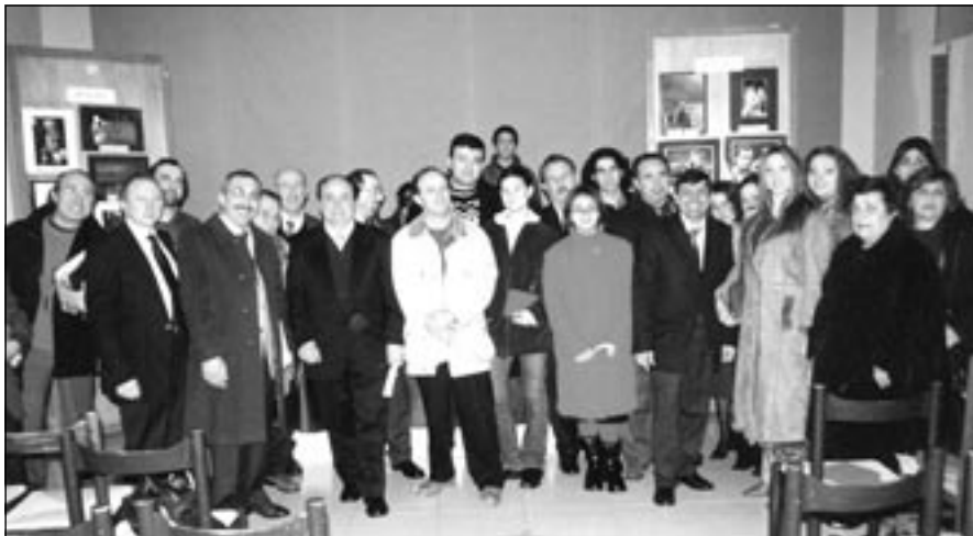
Il folto pubblico partecipante alla serata di premiazione del Concorso.

Con grande successo di pubblico, si è svolta il 24 febbraio u. s., nei locali del Centro di Formazione Professionale di Calcarone, concessi da Mons. Salvatore Cingari, la premiazione dell'ottava edizione del Concorso Fotografico Naxos, indetto dal Fotoclub Naxos di Giardini Naxos (ME).