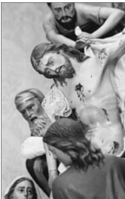
La Depositione - Foto di Michele Dell'Utri.

Si tratta del volume "Suoni & Silenzi - La Settimana Santa a Caltanissetta" che racconta le manifestazioni pasquali attraverso oltre 230 immagini di Valerio Cimino Afi/Bfi e di Michele Dell'Utri. Il corposo volume di 280 pagine è aperto da una prefazione del Vescovo, mons.