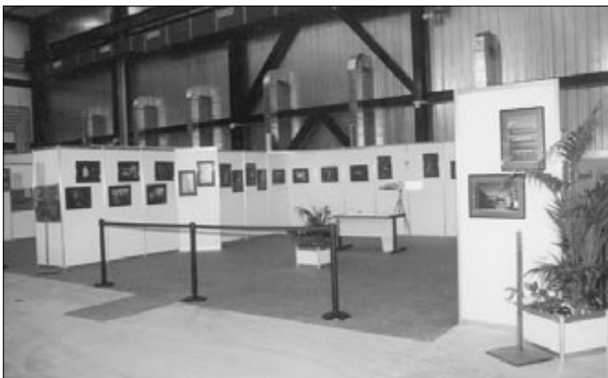
La mostra fotografica allestita all'interno del Laboratorio.