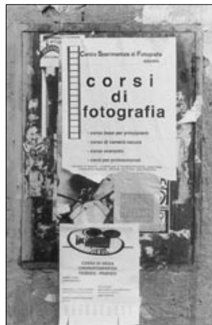
Una foto della mostra.