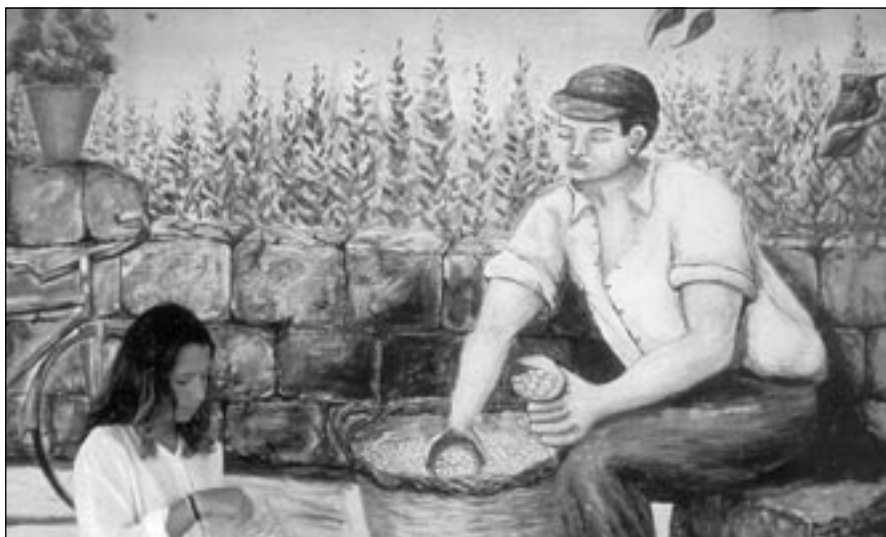
Una foto della mostra.

La sua recente mostra “Percorso Fotografico 1989-2003” è composta da cinque portfolio: Still-life, Paesaggio, Murales e..., Ritr-arte e Percorso del Novecento, in ognuno dei quali l'Artista, dipingendo con la luce, trasferisce la realtà sullo spazio fotografico filtrandola attraverso la visione che gli trasmette l'anima indubbiamente pittorica con la