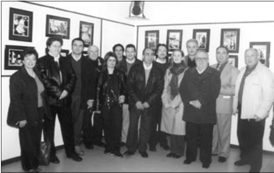
Il gruppo di Autori della Mostra.

di Leonardo Sciascia. Attaccata da più parti - chiesa cattolica principalmente - a causa della ferocia delle parole che Sciascia scrisse per descrivere la religiosità isolana, la pubblicazione, premiata come importante opera foto-editoriale, generò inconsapevolmente ed inaspettatamente una enorme progenie di emuli. Tale capacità generativa è stata fortemente incentivata dall'abbondanza delle manifestazioni che pervadono tutta l'isola. Non c'è paese, infatti, che non celebri, in maniera più o meno sontuosa,