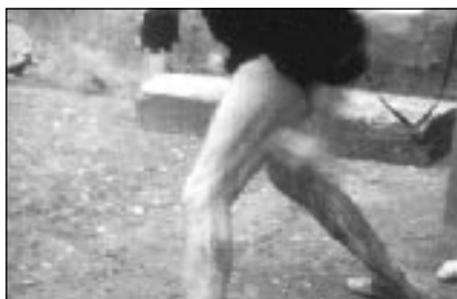
Kamli G. MARCHESE Andes in Memory

La capacità del fotografo è stata nel comporre la sequenza, dall'inizio alla fine, con immagini pregnanti e suggestive, esaltando l'evento anche dal punto di vista emotivo, non solo suo, ma di tutti coloro che hanno vissuto quel giorno o vedono attraverso le sue foto ciò che lui stesso ha visto.