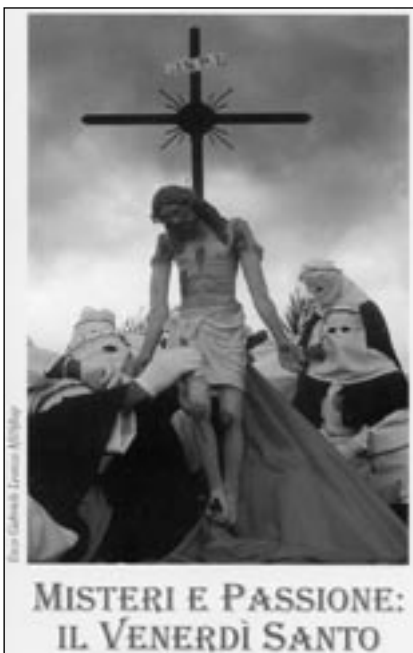
Frontespizio del pieghevole.

il proprio Santo Patrono o la propria Settimana Santa.