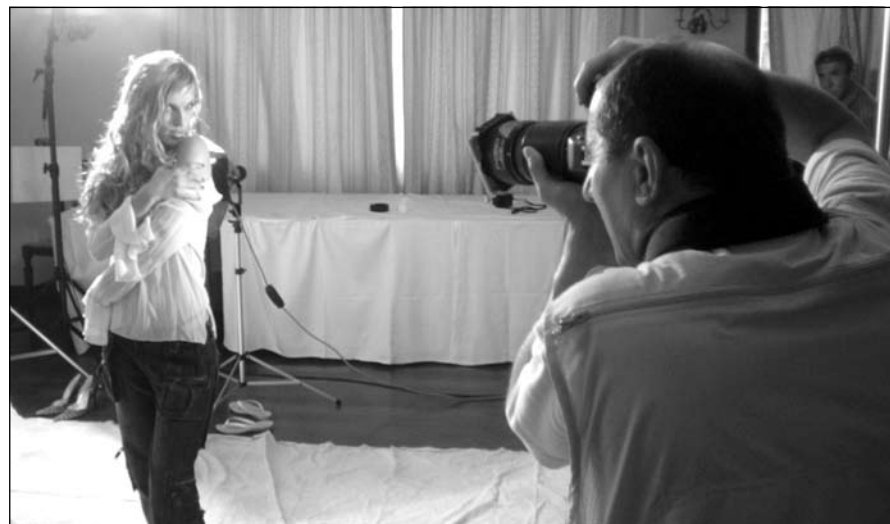
La sala posa con modella all'interno dell'Hotel.