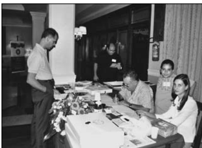
La Segreteria del Raduno.