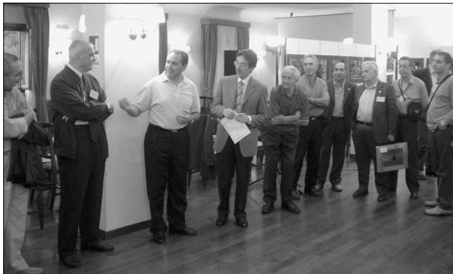
Le Mostre visitate dai partecipanti al 10° Raduno.

Anche quest'anno il DIAF è stato presente al "10° Raduno del Fotoamatore Siciliano" presso il Grand Hotel Bonaccorsi di Pedara (Catania) il 9 e 10 ottobre u.s.