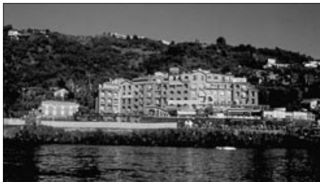
L'Hotel Santa Tecla Palace, sede del Congresso

Patrocinio: Assemblea Regionale Siciliana di Palermo Provincia Regionale di Catania Comune di Acireale - Comune di Valverde Azienda Aut. Incremento Turistico di Catania