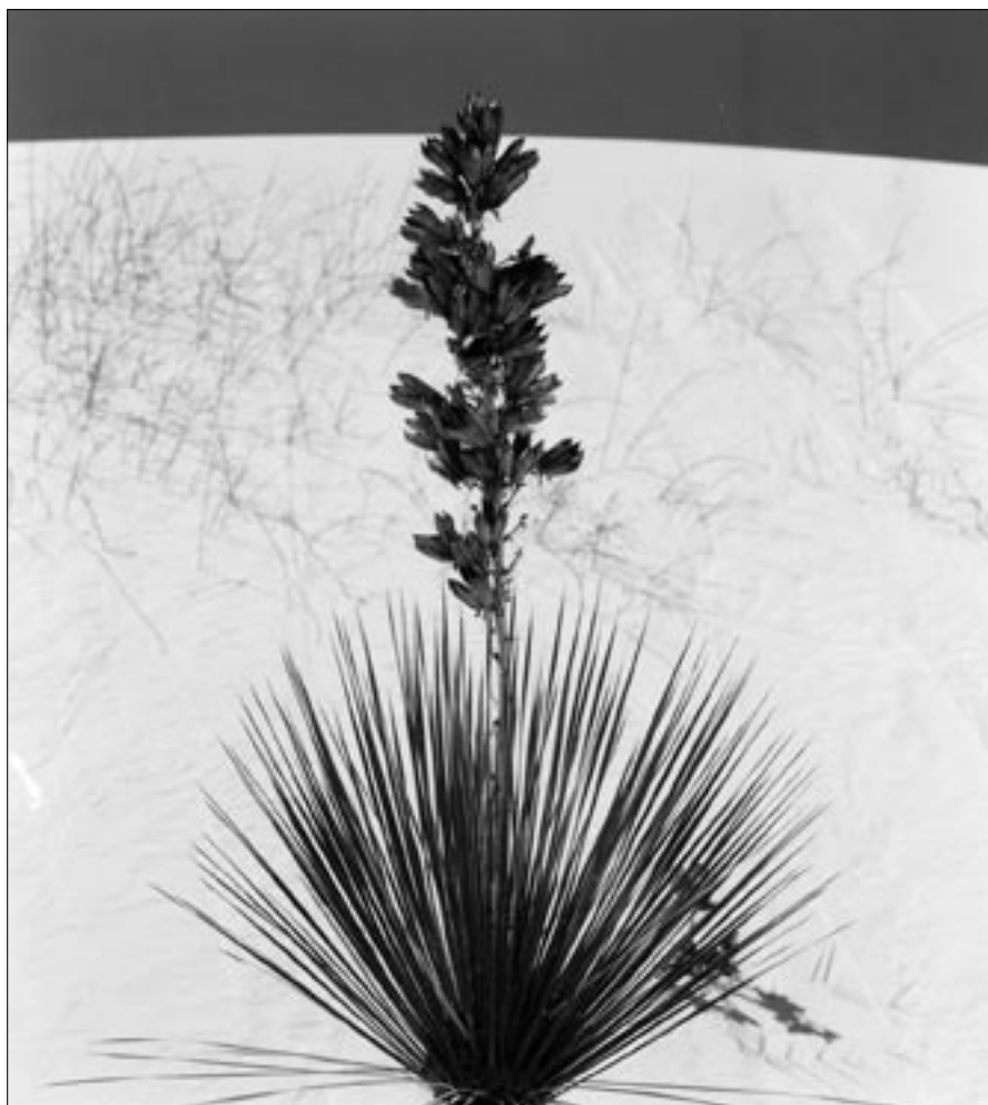
Una foto della Mostra di Luciano Monti.

Giorno 5 dicembre u. s. è stata inaugurata, presso la sede sociale del Gruppo Fotografico Le Gru, la Mostra Fotografica Personale di Luciano Monti dal titolo: "American Landscapes".